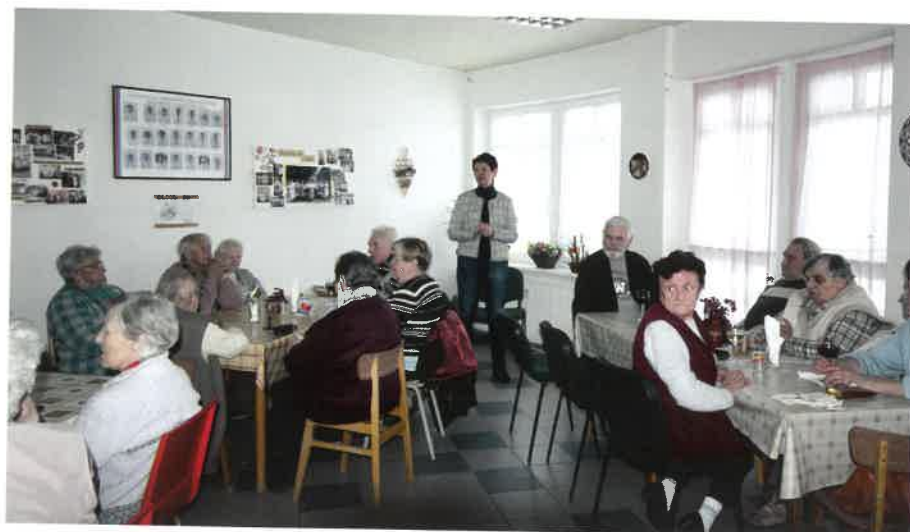
Sobotečtí baráčníci a oslava MDŽ v Domově s pečovatelskou službou