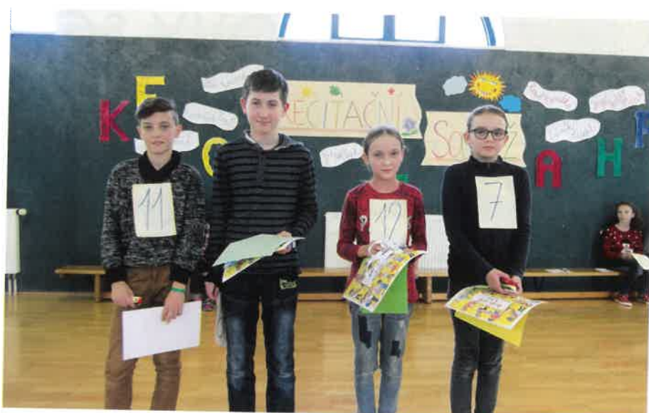
ZŠ Sobotka – recitační soutěž