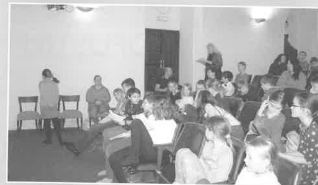
Třetí ročník festivalu „Nezakřiknutí 2018“